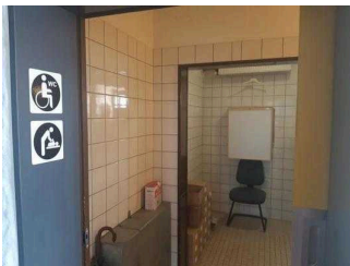
WC der Ortverwaltung