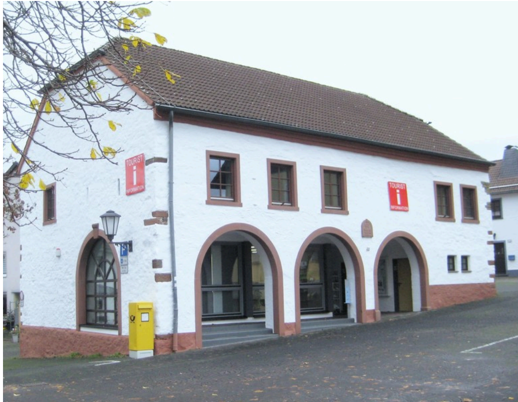
Tourist-Information Stadtkyll | ©Touristik GmbH Gerolsteiner Land