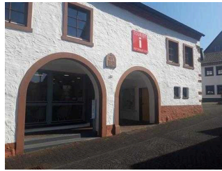
Eingang zur Tourist-Information